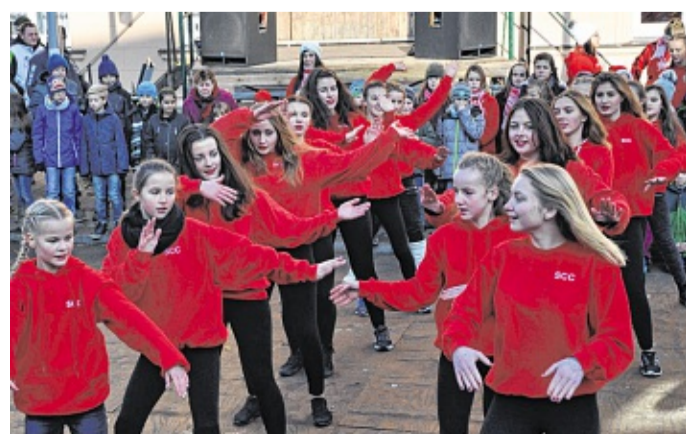
Garde und Superkids tanzen gemeinsam auf dem Markt und geben einen Vorgeschmack auf das grandiose Programm der Karnevalisten.